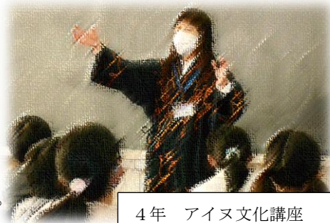
4年 アイヌ文化講座