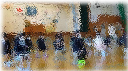
しっかりとお話を聞いています

また、2年生から6年生の児童につきましても新しい担任の先生との学級開きを落ち着いた雰囲気の中で迎えることができました。どの学年の児童にも前向きな気持ちが伝わってきました。特に、新6年生は、一足早い準備登校の折から、責任を果たそうと一生懸命でした。最高学年としての自覚が感じられたスタートとなりました。一年の始まりを良い雰囲気で行うことができました。一年間、どうぞよろしくお祈りいたします。