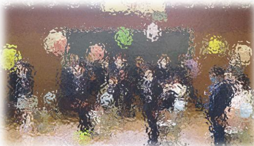
元気よく立ってごあいさつ