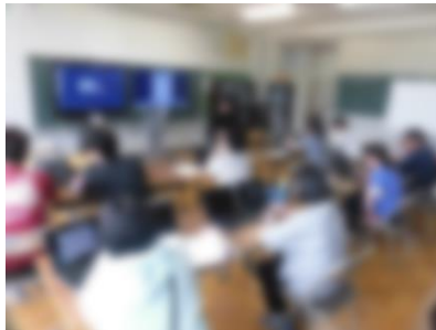
【ロイロノートの教職員研修】