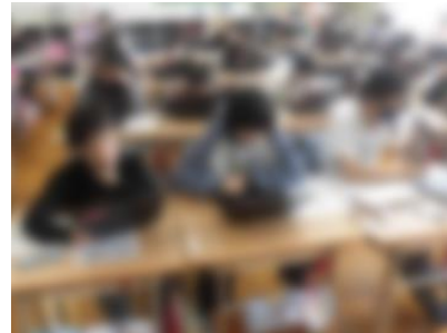
【全国学力学習状況調査児童質問紙への回答】