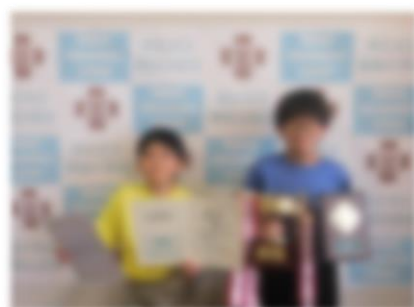
第44回全日本バレーボール 小学生大会帯広地区予選 男子の部 優勝 3年、6年児童 帯広JJB 令和6年5月19日