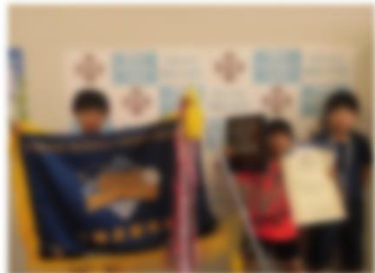
第54回帯広市少年野球大会 帯広市スポーツ少年団交歓大会 高学年の部 第3位 3年、5年児童 ウェストマリナーズ 令和6年6月2日