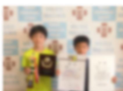
第21回全道少年U-10サッカー北海道大会十勝地区予選 第21回勝毎杯全十勝U-10サッカー大会 第7トーナメント 優勝 3年児童 開西つつじが丘 JrFC 2024年6月16日