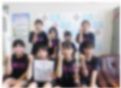
第3回北海道ミニバスケットボールサマーフェスティバル 十勝地区予選会 女子 第3位 2年、4年、5年、6年児童 (森の里ミニバスケット少年団) 2024年6月23日