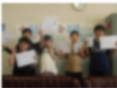
むし歯予防デーポスターコンクール 優秀賞 3年、6年児童 奨励賞 4年、5年、6年児童 令和6年6月1日