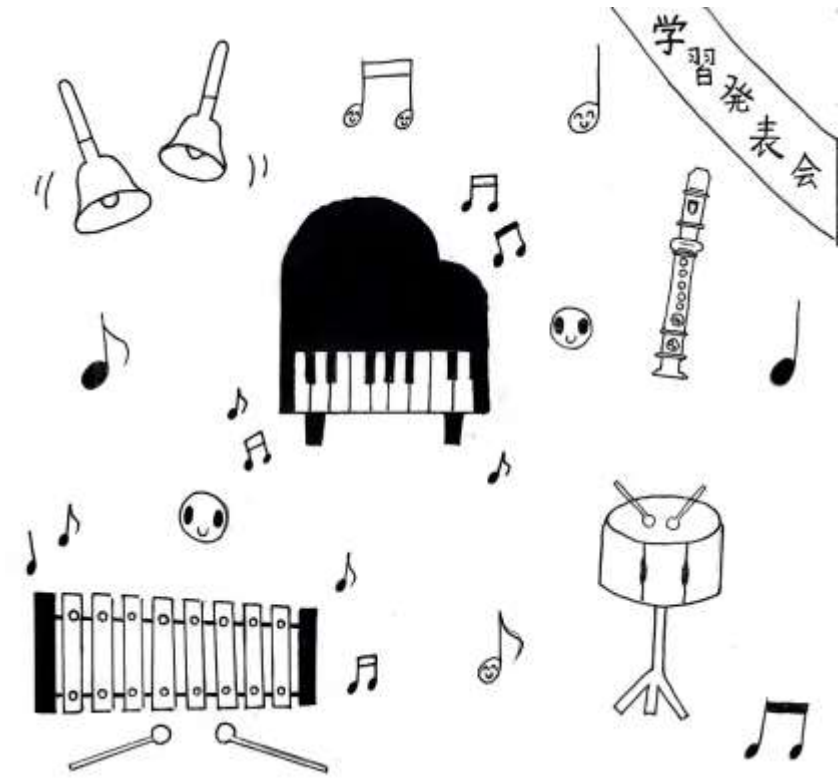
イラスト: 5年 藤山 未唯